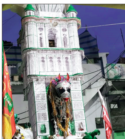
हृ बाजार चोक में में लाया जाता है जहां अलग अलग स्थानों पर यह ताजिये बैठाए जाते हैं।

बतादे की नगर में अलग अलग जगह पर पाच ताजिए इमाम हुसैन की सहादत के रूप में बनाए जाते हैं, जिन्हें ताशे नगाड़ों की धुन पर नगर के विभिन्न मार्गों से होते