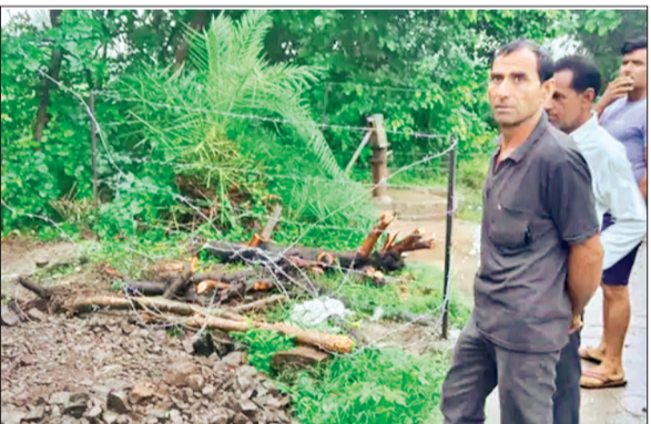
आष्टा। ग्रामीणों ने राशि एकत्रित कर लगाई तार फेंसिंग।